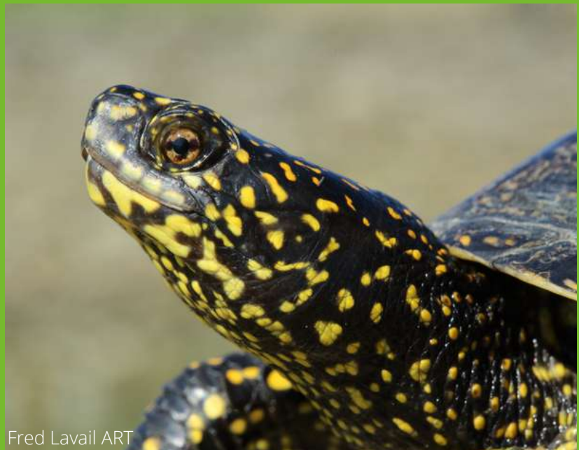
Fred Lavail ART