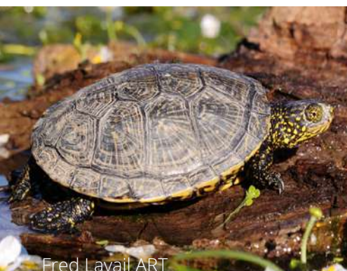
Fred Lavail ART

Le Refuge des Tortues s'investit dans la recherche sur les tortues et la biodiversité. L'association est aussi engagée dans la conservation des tortues, notamment à travers son projet en faveur de l'Émyde lépreuse.