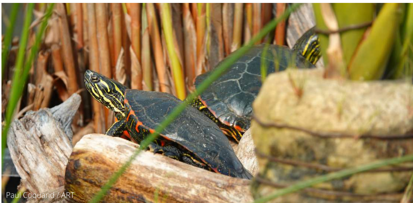
Paul Coquand / ART

C'est un formidable témoignage de la volonté des hommes de prendre leurs responsabilités pour sauver la biodiversité. Ouvert au public, le Refuge accueille les petits et les grands afin de les sensibiliser à la cause des tortues et de la biodiversité !